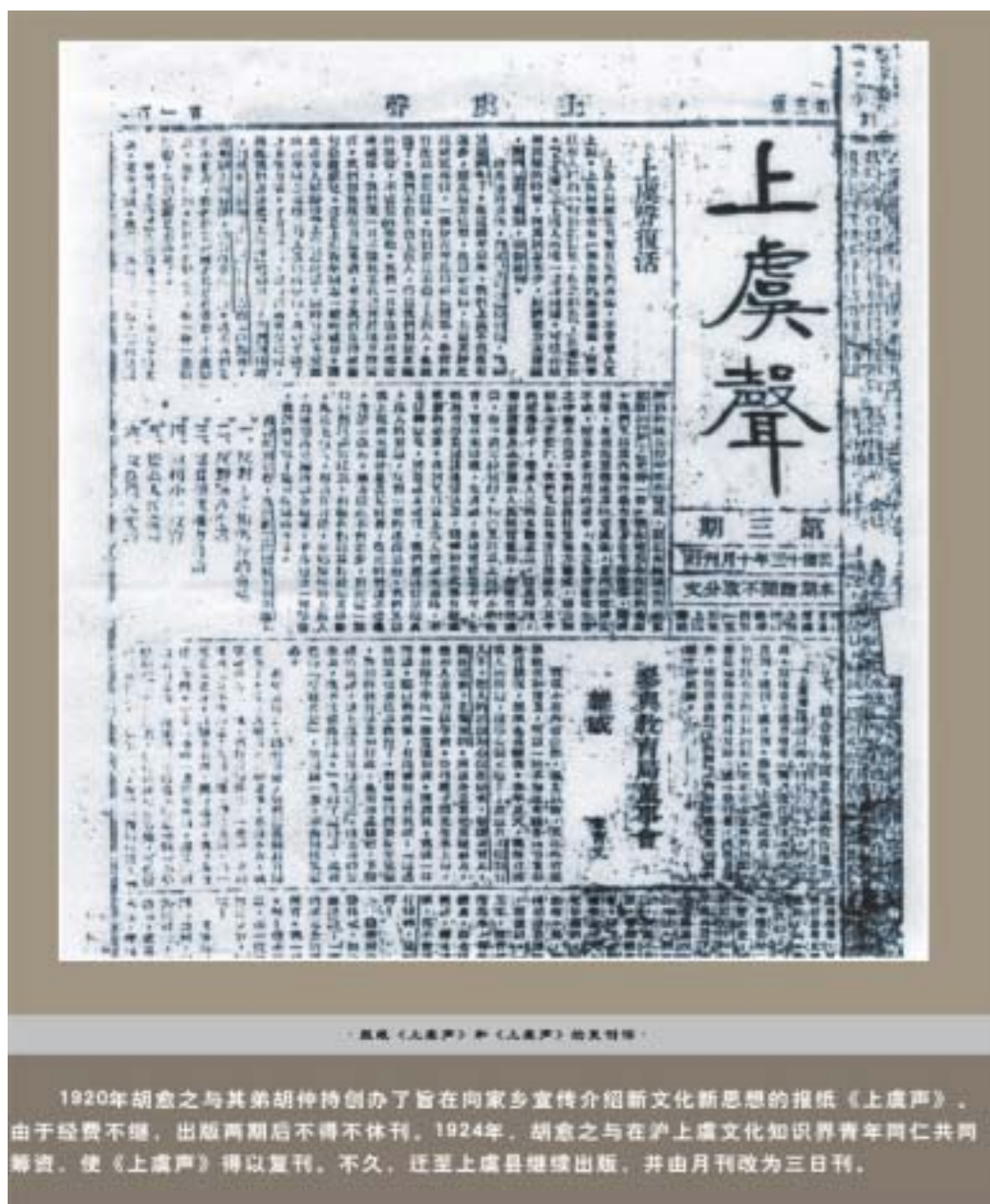
· 原貌《上虞声》和《上虞声》的复刊稿 ·

1920年胡愈之与其弟胡仲持创办了旨在向家乡宣传介绍新文化新思想的报纸《上虞声》。由于经费不继，出版两期后不得不休刊。1924年，胡愈之与在沪上虞文化知识界青年同仁共同筹资，使《上虞声》得以复刊。不久，迁至上虞县继续出版，并由月刊改为三日刊。