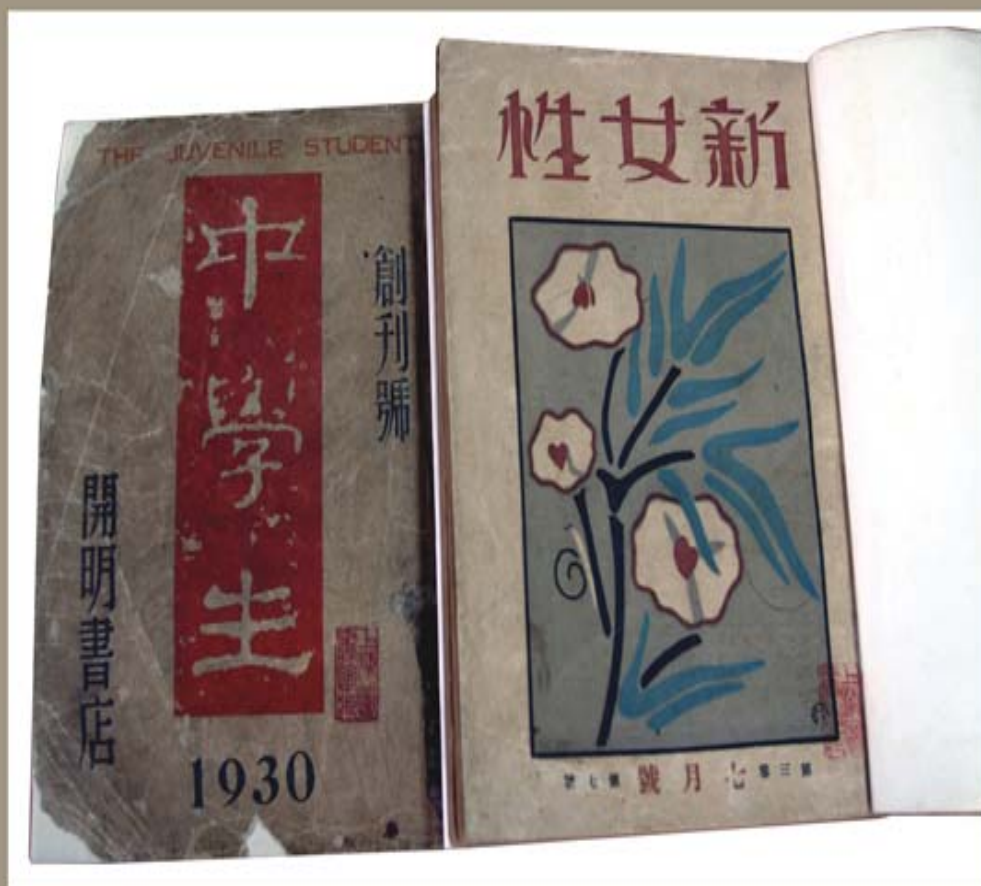
· 开明书店出版的《新女性》杂志和《中学生》杂志 ·

1926年，胡愈之与章锡琛、郑振铎、夏丏尊、叶圣陶等人一起，积极策划和筹备出版《新女性》杂志和开办开明书店，并为书店拟订编辑方针，组织书稿，为书店的发展奠定了基础，因而被誉为开明书店的“参谋长”。